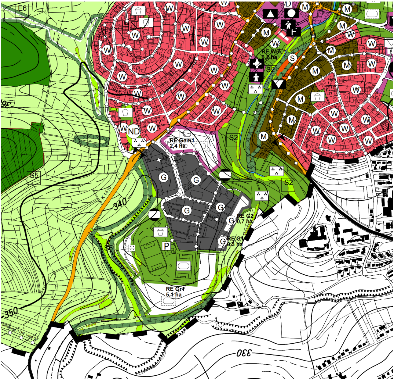
Abb. 2: Flächennutzungsplan 2020 GVV Östlicher Schurwald (Bestand)

In diesem Bereich ist im bestehenden Flächennutzungsplan eine geplante Grünfläche mit der Zweckbestimmung Sportflächen dargestellt. Diese soll der Entwicklung des Sportparks Lindach dienen.